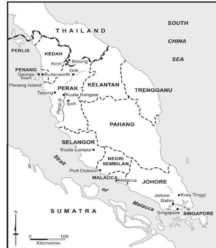
Map of Malaya 1948